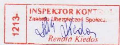
(Pieczęć i podpis inspektora kontroli ZUS)

Protokół kontroli doręczono osobie upoważnionej do reprezentowania płatnika składek.